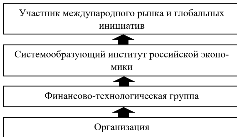
Рис. 3. Уровни воздействия принципов ESG, установленные в области социальной и экологической ответственности ПАО «Сбербанк»