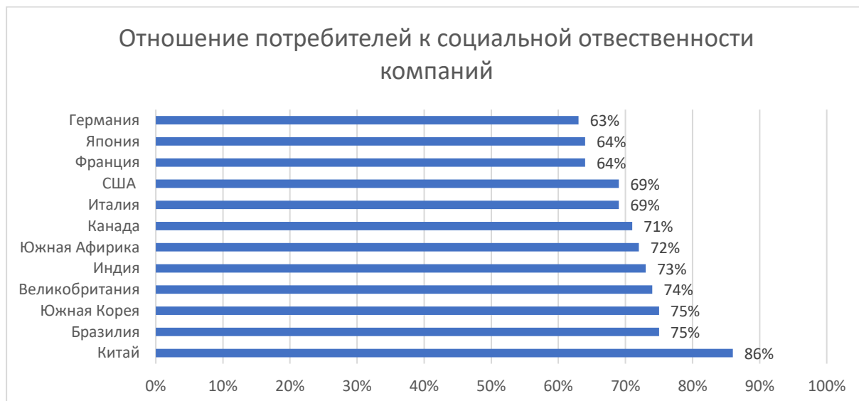
Рис. 2. Отношение потребителей к социальной ответственности компаний